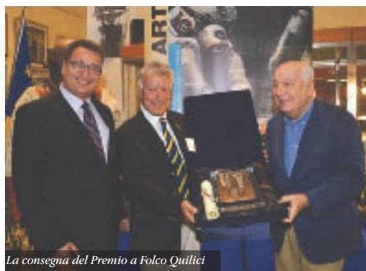
La consegna del Premio a Folco Quilici